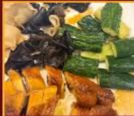
ไก่ แดงกวาง เห็ดหูหนู