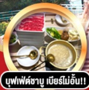
บุฟเฟ่ต์ชาบู ภัตตาคารจีน!!