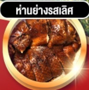
हांอย่างรสเลิศ