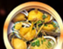
เมนูซีฟู้ดลิ้นจี่