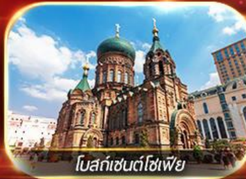
โบสถ์เซนต์โซเฟีย