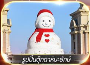
รูปปั้นตุ๊กตาหิมะยักษ์