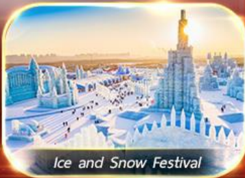
Ice and Snow Festival