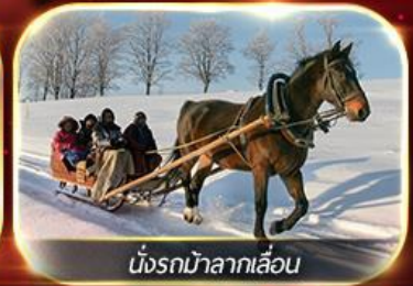
นั่งรถม้าลากเลื่อน

ฟรีนั่งรถม้าลากเลื่อน ชมโชว์ว่ายน้ำน้ำแข็ง แม่น้ำชงหวาเจียง