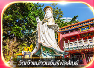
วัดเจ้าแม่กวนอิมรพัสลันย์