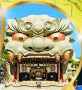
ศาลเจ้า นัมมะ ยาชากะ