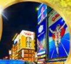
ช้อปปิ้ง ชินโซบาชิ