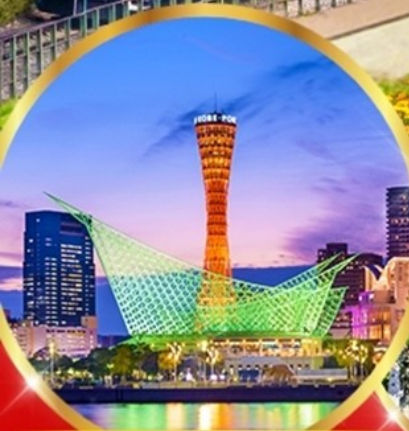
เมืองโกเบ