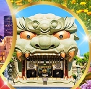
ศาลเจ้านันบะ ยาชากะ