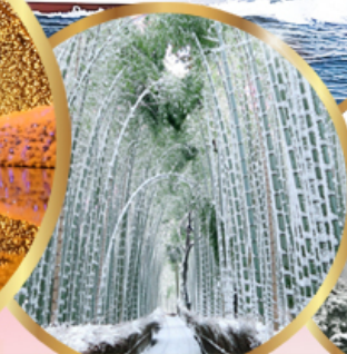
ป่าไฟ อาราชิมายา