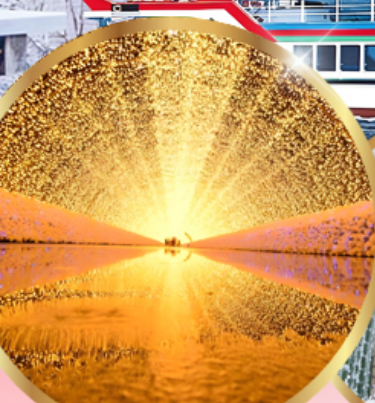
นาบาระ โนะ ซาโตะ