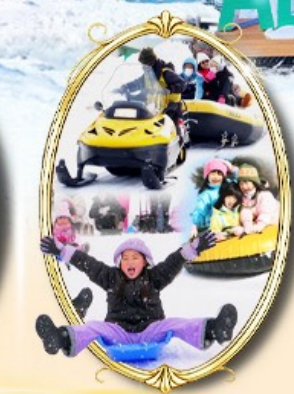
Bokka no Sato