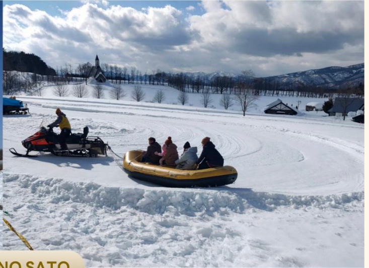
BOKKA NO SATO