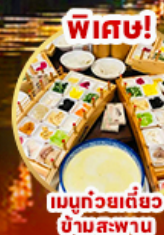
พิเศษ! เมนูถ้วยเดียว ข้ามสะพาน