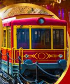
รถรางซาปา