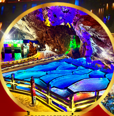
ถ้ำนกนางแอ่น