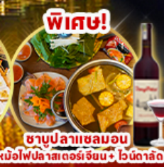
พิเศษ! ชาบูปลาหมอน หม้อไฟปลาหมอนจีน+ไวน์ดालิต

ราคาเริ่มต้น 18,919 บาท รวมภาษีมูลค่าเพิ่ม 7%