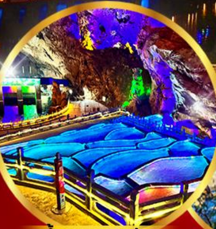
ตำนานทางแอน