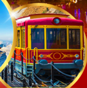
รถรางซาปา