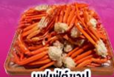
บุฟเฟ่ต์ขาปู