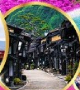
นาราจิคุ