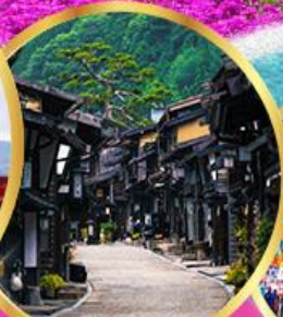
นาราอิซูกุ