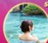
พักผ่อนแช่น้ำ 1 คืน