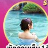
พักผ่อนเขิน 1 คืน