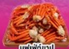
บุฟเฟ่ต์ซาปู