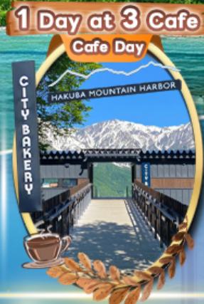
The City Bakery