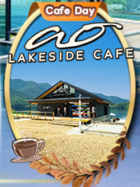
Ao Lakeside Cafe