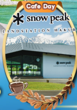
Snow Peak Land Hakuba

รหัสทัวร์ RJ-XJ125 เดินทาง 6D 4N 24 - 29 มิ.ย. 69 18 - 23 ก.ค. 69 03 - 08 ก.ย. 69