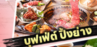
บุฟเฟต์ ปิ้งย่าง