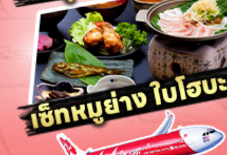
เช็กเมนูย่าง ใบโอบะ

29,919 ราคาเริ่มต้น บาท รวมภาษีมูลค่าเพิ่ม 7%