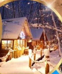
หมู่บ้านเทพนิยาย นิงเกิลทอเรส