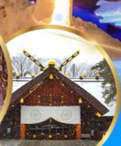
ศาลเจ้า ออกโทโต

เดินทาง 04 - 09 กุมภาพันธ์ 68 05 - 10 กุมภาพันธ์ 68