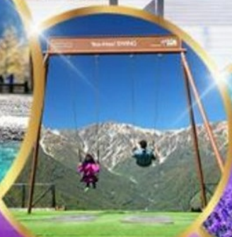
ชิงช้า Yoo hoo! Swing