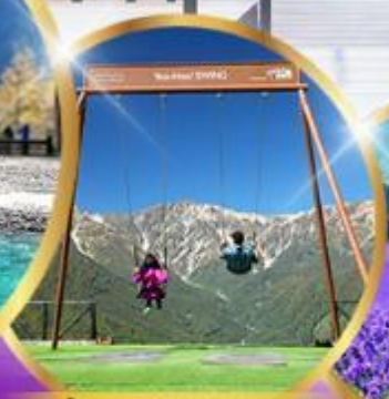
ชิงช้า Yoo hoo! Swing