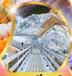
หุบเขานรกจิทอกุตามิ