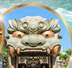
ศาลเจ้านิมะ ยาชากะ