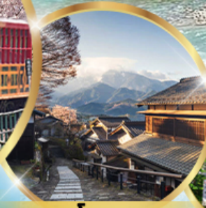
มาโกเมะจุกุ