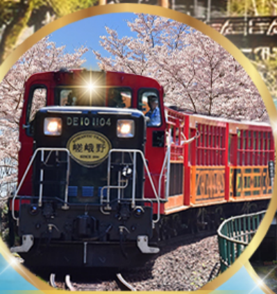
รถไฟสายโรแมนติก