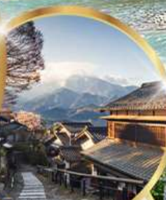
มาโกเมะจุกุ