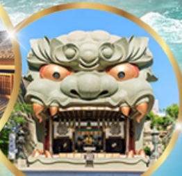
ศาลเจ้านิมะ ยาชากะ