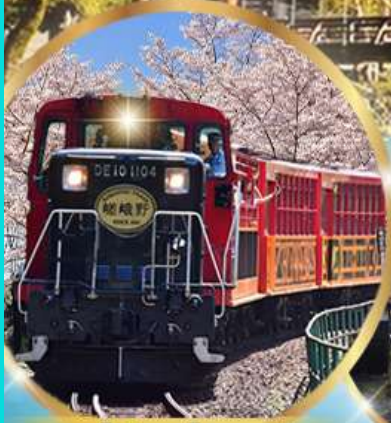
รถไฟสายโรแมนติก