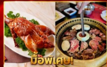
บิวเฟส! เปิดอย่างฮ่องกง บิวเฟสปังย่างเกาหลี