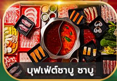
บุฟเฟ่ต์ซาบู ซาบู