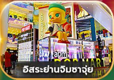
อิสระยานจิมซาจุย