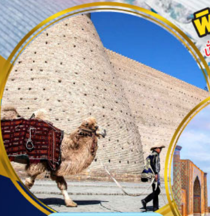
บ้อมปราทารบุการ์่า