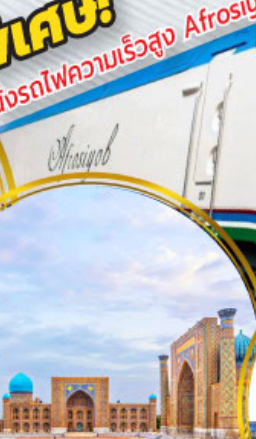
จัตุรัสเรจิสถาน