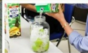
เวิร์กช็อปทำ Umesu