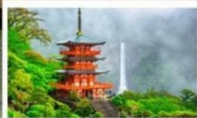
ศาลเจ้าคามาโนะนาจิ