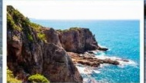
ท้ำซันดินเบกิ