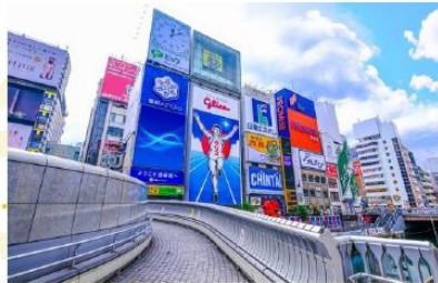
SHOPPING AT SHINSAIBASHI