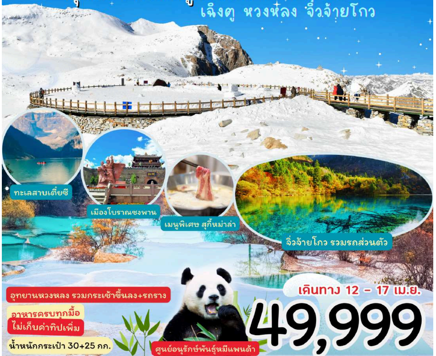
ทะเลสาบเตี้ยซี