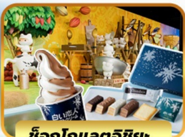
ช็อกโกแลตชิช: