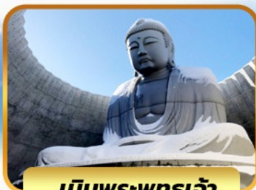
เป็นพระพุทธรเจ้า

05-10, 12-17, 19-24 พ.ย. 26 พ.ย. - 01 ธ.ค. 67