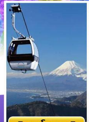
อิซุฟานรามาวิว