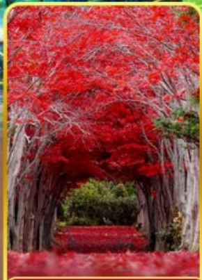
สวนอิระโอกะ