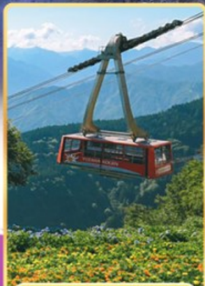
นั่งกระเช้าชูซาว่าโคเอ็น