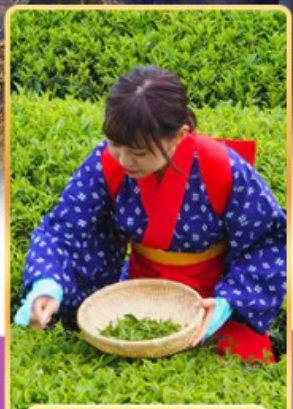
กิจกรรมเก็บชา