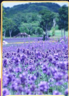
ทุ่งลาเวนเดอร์ทัมบาระ