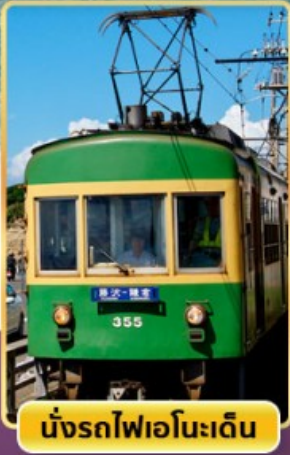
นั่งรถไฟเอโนะเด็ง