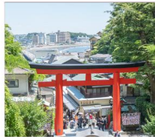
ถนนเม็นไซเท็นเอโนะชิมะ