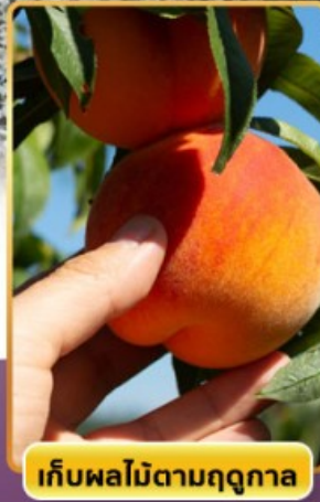
เก็บผลไม้ตามฤดูกาล

🔥 ออนเซ็น 3 คืน 🧳 นน.กระเป๋า 23 กก. ☀️ 8Days 5Night