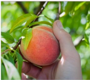
เก็บผลไม้ตามฤดูกาล