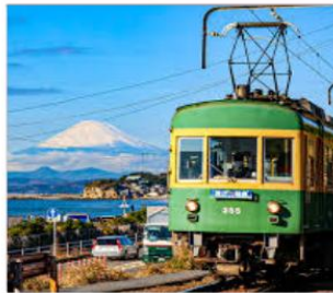
นั่งรถไฟเอโนะเด็น