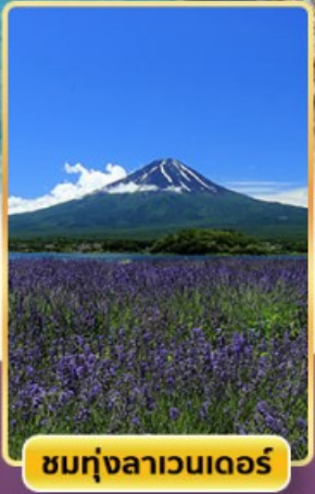
ชมทุ่งลาเวนเดอร์