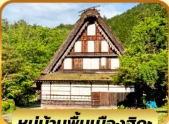
หมู่บ้านพื้นเมืองฮิดะ