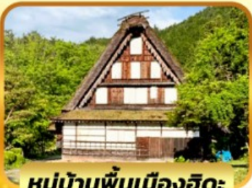
หมู่บ้านพื้นเมืองฮิดะ