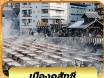
เมืองคุสัทซึ