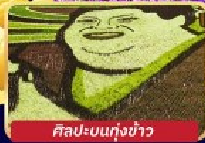
ศิลปะบนทุ่งข้าว