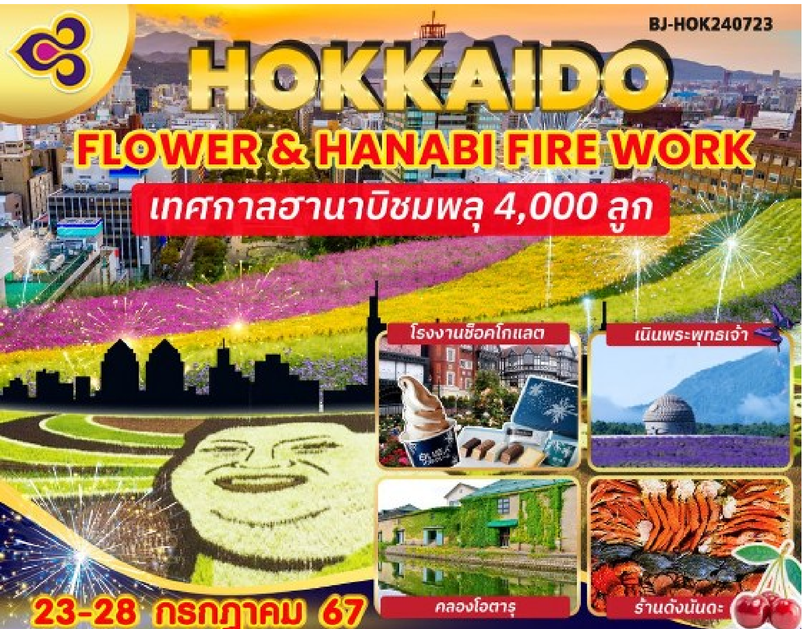
โรงงานช็อคโกแลต