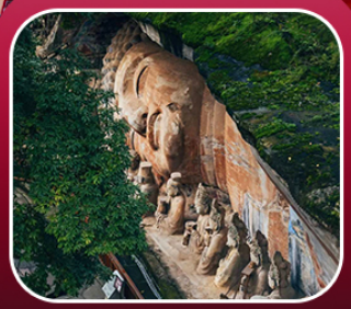
“ผาหินแกะสลักต้าจู้”