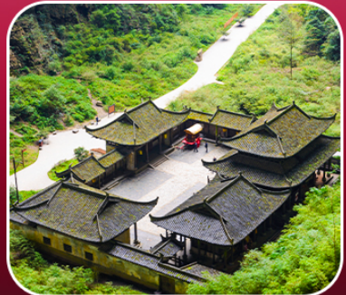
“อุทยานหลุมฟ้า”