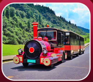
“อุทยานเขานางฟ้า”