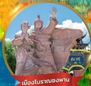
เมืองโบราณซงฟาน