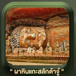
“ ฝาศืบแกะสลักต้าจู้ ”

บินตรงลงฉงชิ่ง • อุ่หลง หลุมฟ้าสะพานสวรรค์ • ระเบียบแก่ว • อุทยานเขานางฟ้า หงหยาดัง • นิ่งรถไฟทะเลลัด • ศาลาประชาม (ด้านนอก) • หลงหมินฮ่าว มรดกโลกฝาศืบแกะสลักต้าจู้ • วัดหลิวอัน • ตึกตะเกียบ • ถนนคนเดินเจียฝางเป่ย์