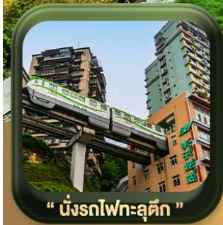
“ นิ่งรถไฟทะเลลัด ”