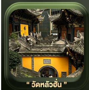
“ วัดหลิวอัน ”