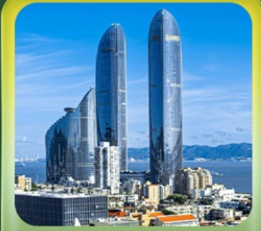
“ตึกแฝดเซี่ยเหมิน”