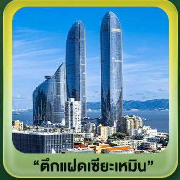
“ตึกแฝดเซี่ยเหมิน”