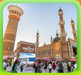
"ตลาดต้าปาจา"

ซินเจียงเหนือ ทะเลสาบไซลีมู่ "น้ำตาหยดสุดท้ายของแอตแลนติก" • ทุ่งหญ้านาราตี ทุ่งดอกไม้เทียนซาน • ผ่านชมสะพานกั๋วจื่อโกว • ถนนหลิวซิงเจียง • ตลาดต้าปาจา