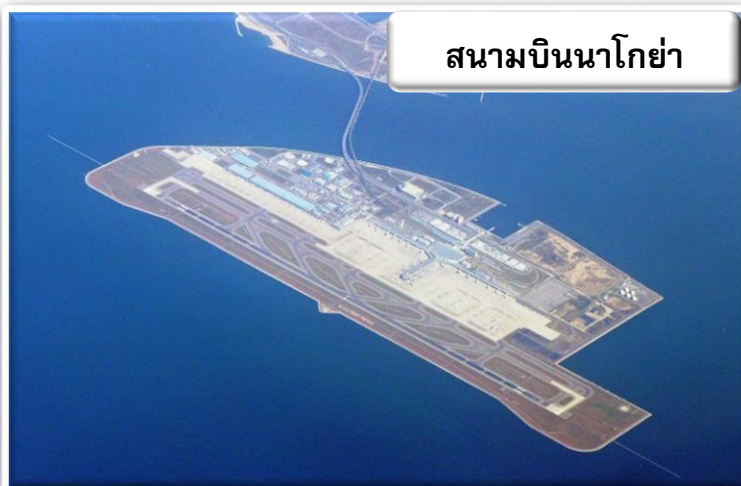
สนามบินนาโกย่า

บริการอาหารร้อนบนเครื่องพร้อมกับเมนูผลไม้สดเพื่อเติมเต็มความพิเศษไปพร้อมๆกับความสดชื่น