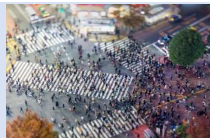
ย่านชิบูย่า – แหล่งรวมวัยรุ่น แฟชั่น

ทะเลสาบคาวากูจิโกะ ในฤดูหนาวที่นี้คือสวรรค์ที่งดงามสำหรับผู้ที่หลงใหลในความเงียบสงบและความงามของธรรมชาติ เมื่อหิมะปกคลุมภูเขาไฟฟูจิและพื้นที่โดยรอบ ทิวทัศน์ที่นี้จะเปลี่ยนเป็นภาพที่งดงามราวกับออกมาจากภาพวาด หนาวที่นี้เต็มไปด้วยบรรยากาศที่โรแมนติก จากนั้น...นำพาทุกท่านสู่ DUTY FREE ที่ให้ทุกท่านได้เลือกซื้อหรือจะเลือกซื้อเป็นของฝากได้ตามอัธยาศัย โดยสินค้าที่แนะนำ เช่น วิตามินบำรุงสุขภาพ สรรพคุณหลากหลายชนิด และสินค้าชื่อดังของญี่ปุ่น โฟมล้างหน้าถ่านหินภูเขาไฟ และ เครื่องสำอางค์ Special Set และอื่นๆ อีกมากมาย จากนั้นขอพาทุกท่านเข้าสู่...กรุงโตเกียว แวะกันที่ ย่านชิบูย่า (SHIBUYA) หนึ่งในจุดหมายที่ห้ามพลาดสำหรับผู้รักแฟชั่นและการช้อปปิ้งแสนหรูของชิบูย่าไม่เพียงแต่เป็นที่รู้จักจาก "ห้าแยกชิบูย่า" ที่มีชื่อเสียง ที่นี้ยังมีร้าน POP MART ที่เอาใจสายจุ่มอีกด้วย นอกจากนี้ยังมีร้านค้าหรูหราและร้านแฟชั่นที่ทันสมัยมากมาย เช่น SHIBUYA 109 และ PARCO รวมไปถึงคาเฟ่ และร้านอาหารที่น่าสนใจอีกมากมายที่คุณสามารถแวะไปพักผ่อนระหว่างการช้อปปิ้ง และให้ทุกท่านได้เพลิดเพลิน เรา อีสาระอาหารเย็น เพื่อให้ทุกท่านได้เลือกรับประทานอาหารได้ตามอัธยาศัย