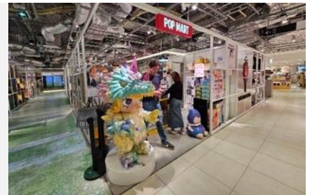
POP MART สายจุ่มถูกใจสิ่งนี้ !