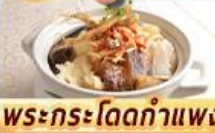
พระกระโดดกำแพง