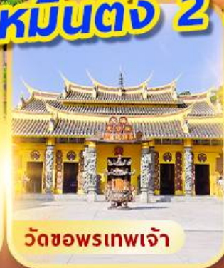
วัดขอพรเทพเจ้า