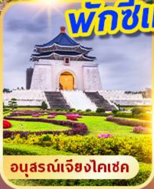
อนุสรณ์เจียงโคเซค