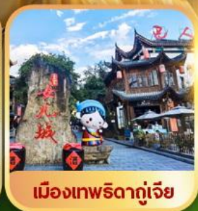
เมืองเทพริดาตุ๋เจีย