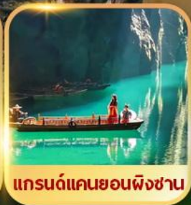
แกรนด์แคนยอนผิงชาน