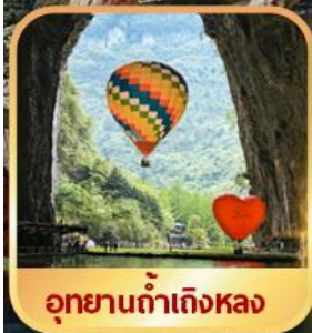
อุทยานถ้ำเกิ่งหลง