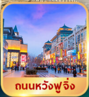
ถนนหวงฟู่จิ่ง