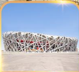
สนามกีฬารังนก