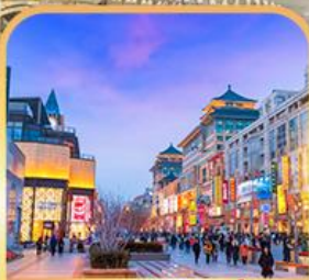
ถนนหวงฟูจิ่ง