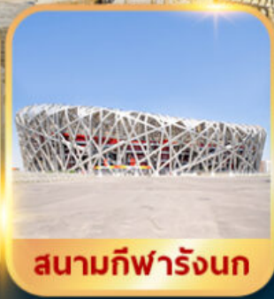
สนามกีฬาโอลิมปิก