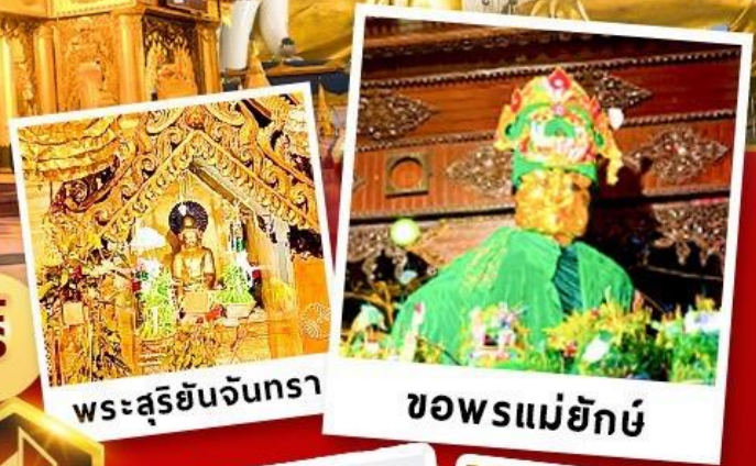
พระสุริยันจันทรา