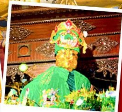
ขอพรแม่ยักษ์