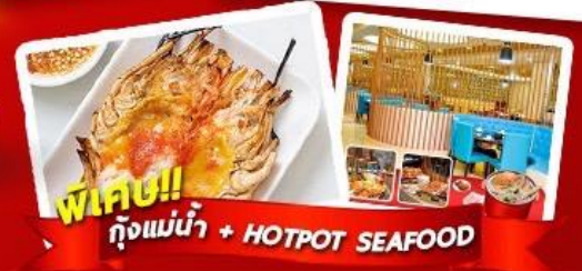
พิเศษ!! กุ้งแม่น้ำ + HOTPOT SEAFOOD