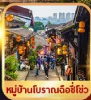
หมู่บ้านโบราณฉือชี่เซว่