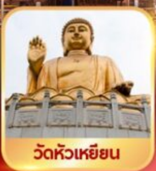
วัดหัวเหยียน