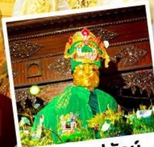
ซอพรแม่ยักย์