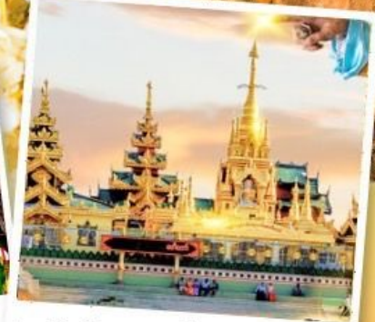
เจดีย์กลางน้ำ (สิริเรียม)