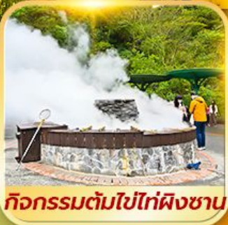
กิจกรรมต้มไข่ไท่ผิงซาน