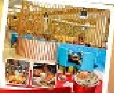
ก๊วยเม้งน้ำ + HOTPOT SEAFOOD