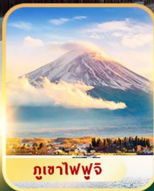
ภูเขาฟูจิ