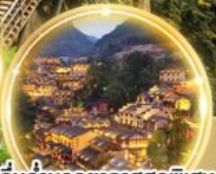
ดื่มด่ำบรรยากาศสุดพิเศษ พร้อมพิกินหุบเขา