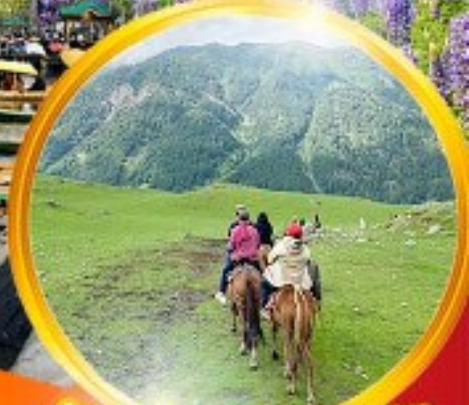
ขี่ม้าชมความงามของหุบเขา