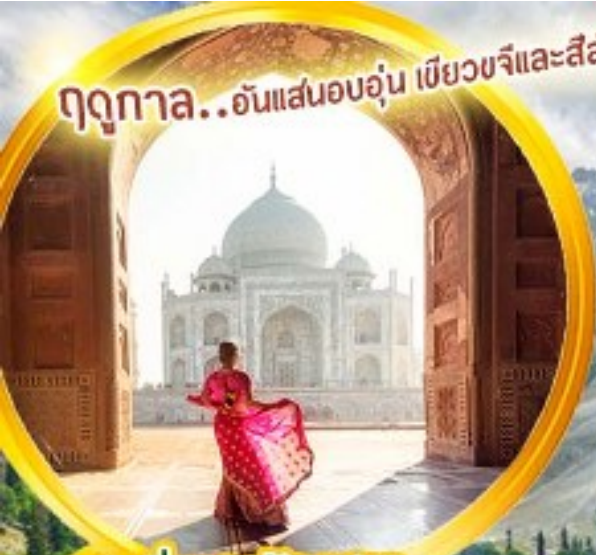
เที่ยวชมทัชมาฮาล

ฤดูกาล...อันแสนอบอุ่น เบียววจีและสีสันของดอกไม้ป่า