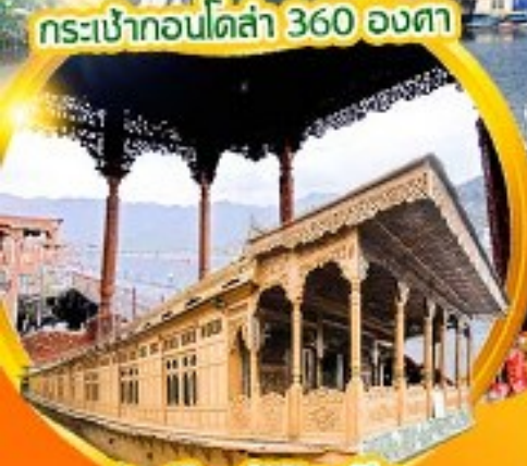
บ้านเรือสมัยวิตอเรีย