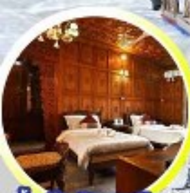
บ้านเรือ..วิมานบนดิน