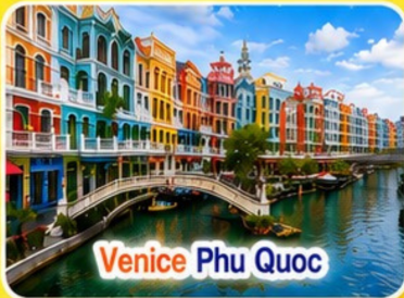
Venice Phu Quoc