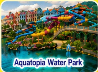
Aquatopia Water Park