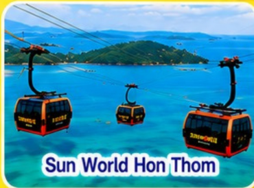
Sun World Hon Thom